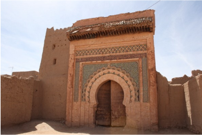
puis de l'ancien palais royal,