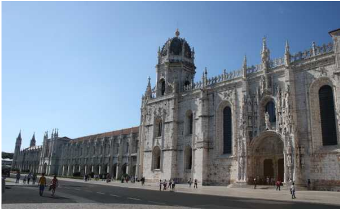
Le monastère est magnifique avec ses plafonds en ogive et ses sculptures torsadées très fines.