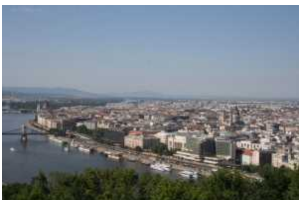
...au camping Haller.