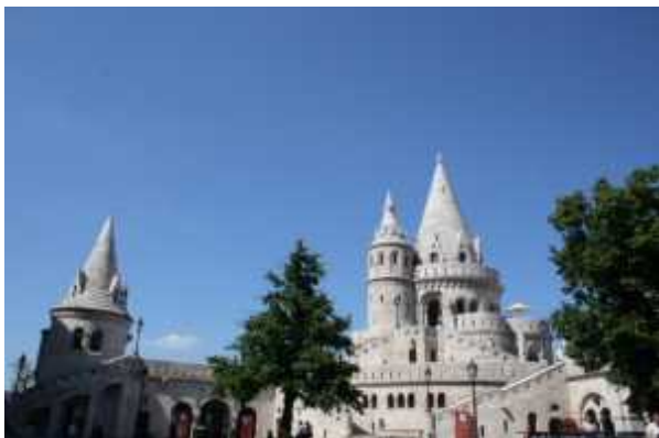
Pest vue de la citadelle

Le bastion des pêcheurs avec vue sur le parlement.