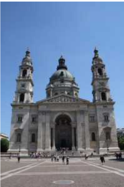
La basilique St Istvan.

Nous déjeunons sur la terrasse d'un restaurant de la rue Vaci puis poursuivons la visite de Pest.